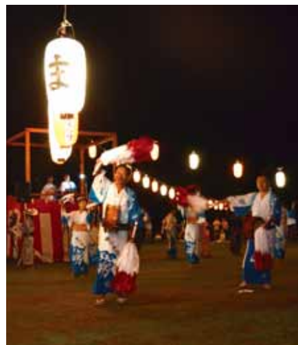
今年は、西川踊り保存会による大踊り